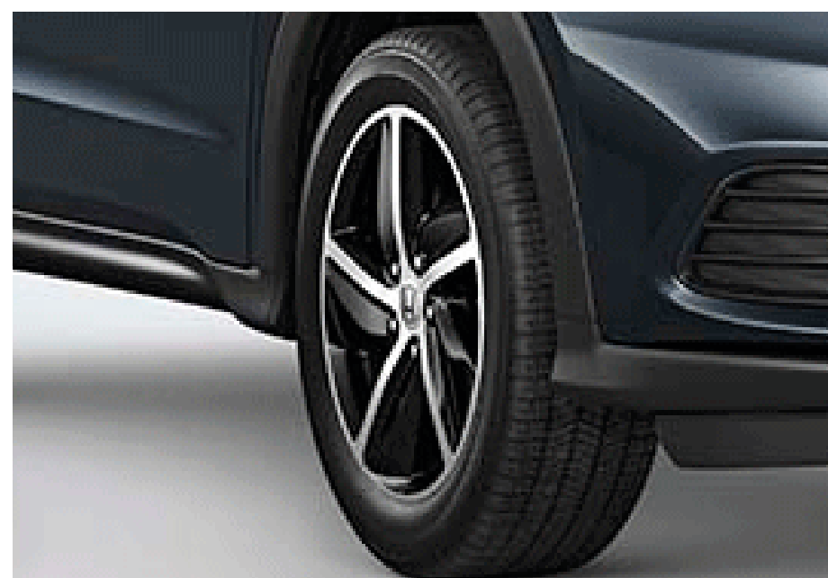
Aros de aleación 17" Bitono