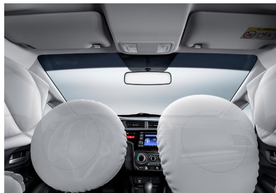
4 Bolsas de aire