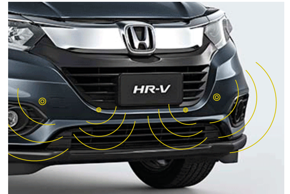
Sensores de proximidad posteriores