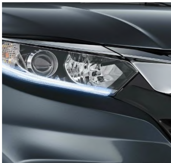
Luces delanteras LED