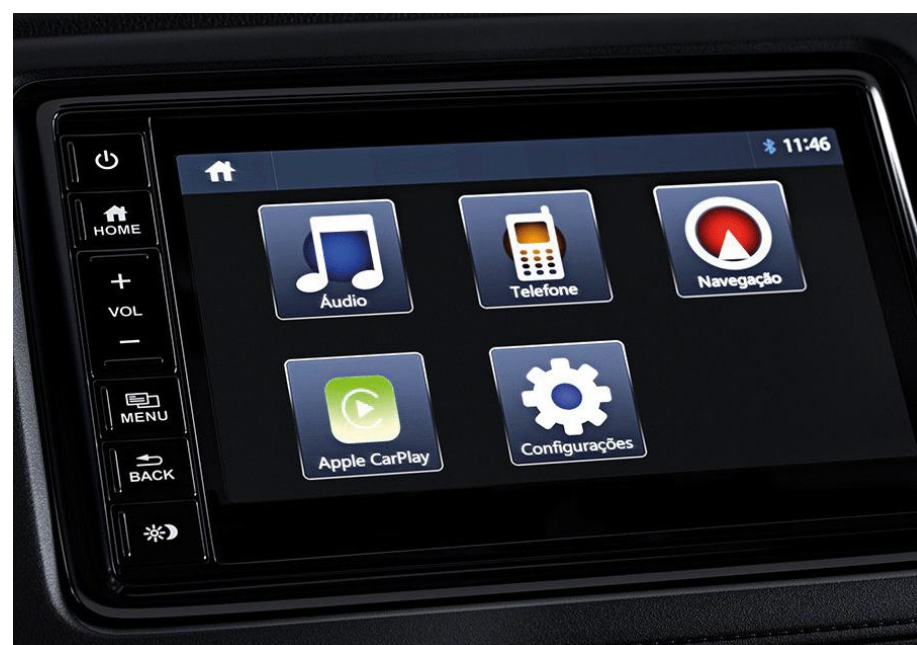
PANTALLA táctil 7" compatible con Apple Carplay y Android auto