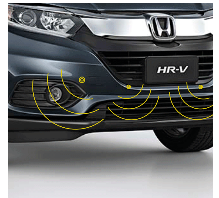
Sensores de proximidad delanteros y posteriores