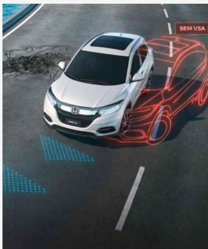
Sistema VSA - Asistente de estabilidad y tracción