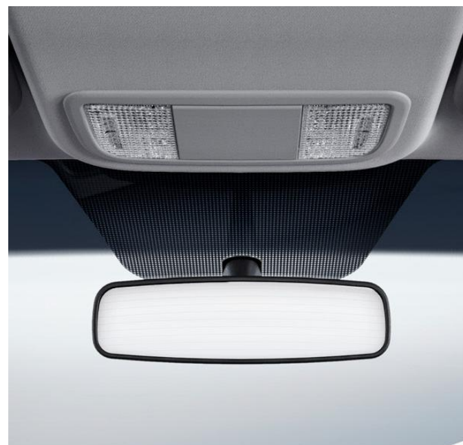
Retrovisor con oscurecimiento automatico