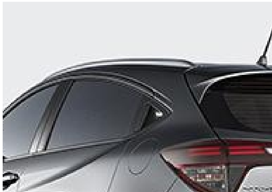
Rieles de techo