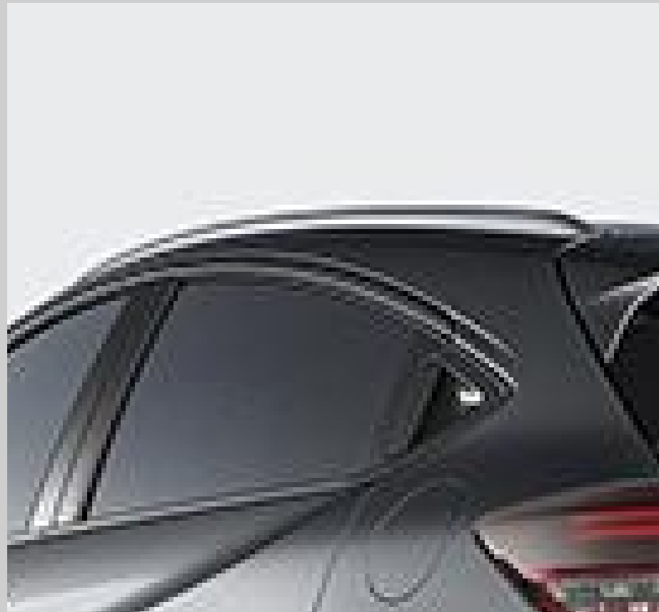
Rieles de techo