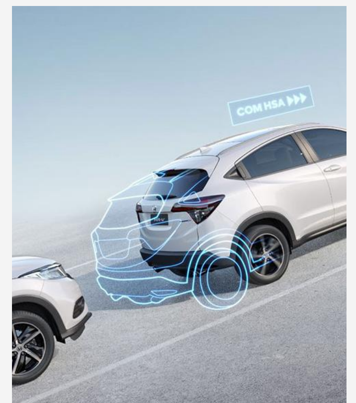
HSA - Asistente de arranque en pendiente