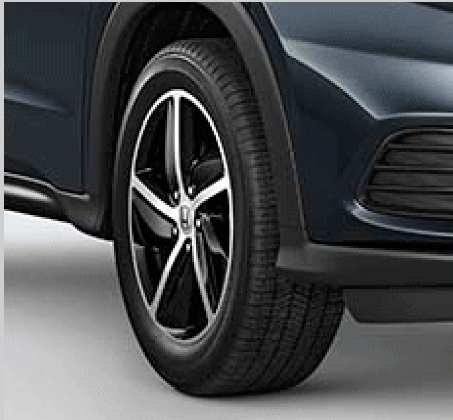
Aros de aleación bitono