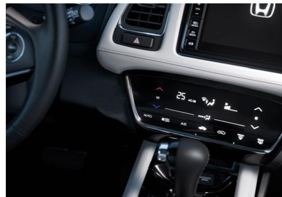
Aire acondicionado táctil