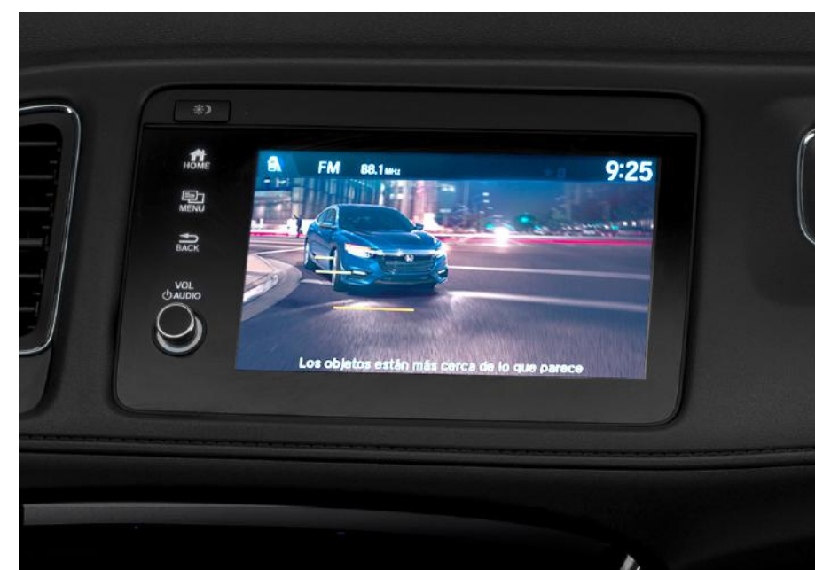
Camara de retroceso 3 vistas