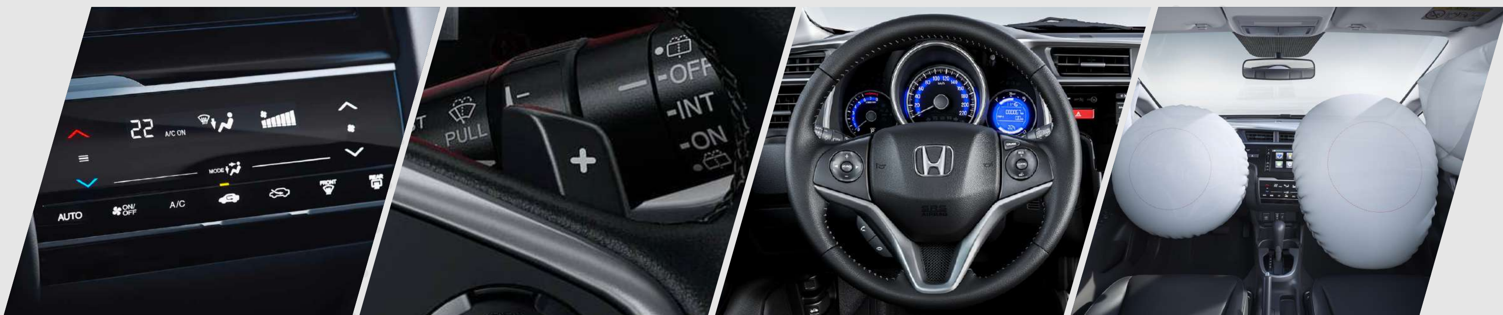
Auto aire acondicionado táctil