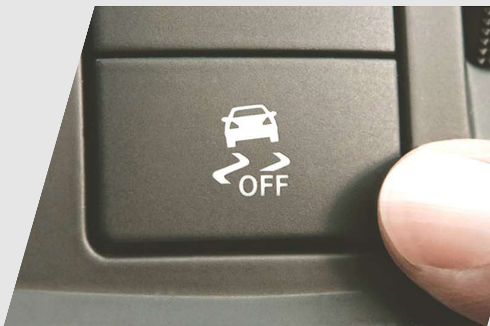
VSA – Asistente de estabilidad