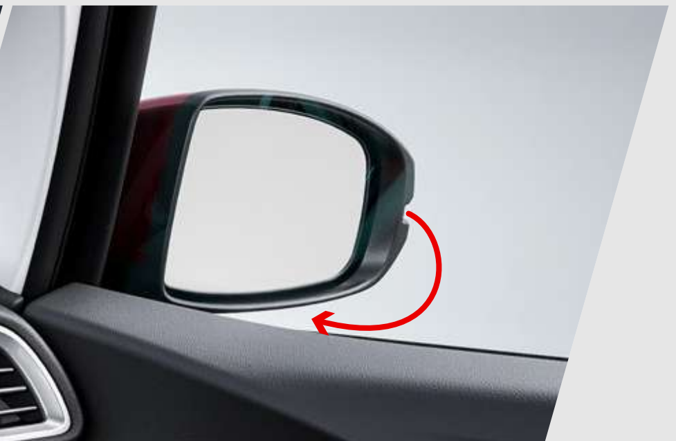
Espejo de inclinación automática