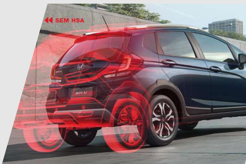
HSA – asistente de arranque en pendiente