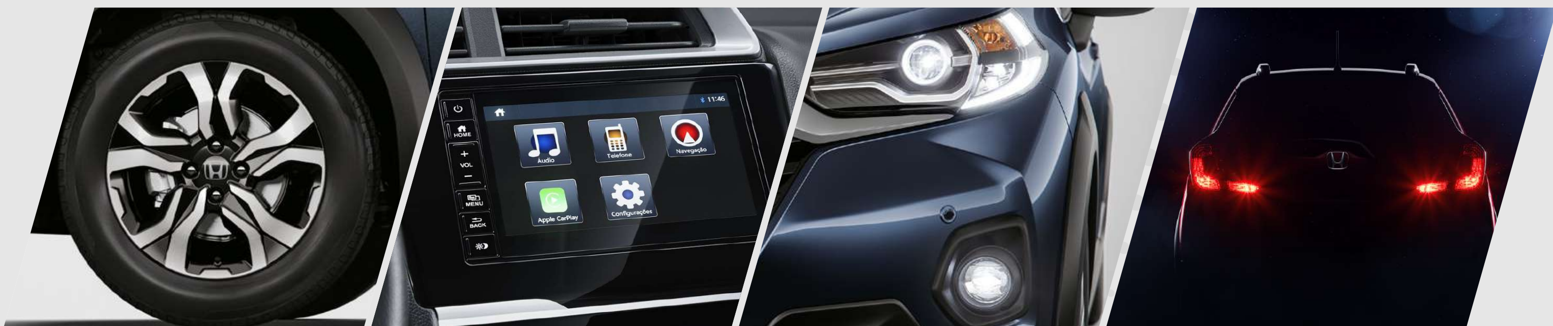
Aros de aleación con acabados de diamante y negro