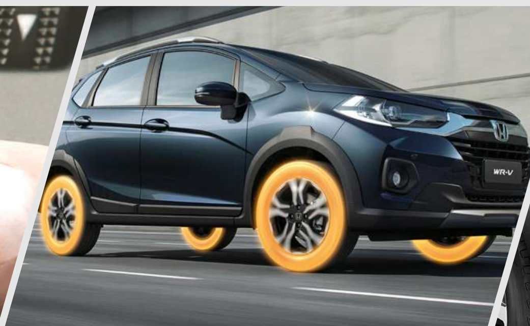
TPMS – Monitor de presión y tracción