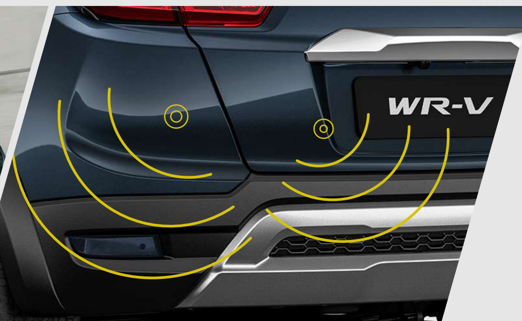
Sensores de retroceso