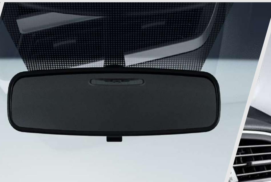
Retrovisor con oscurecimiento automático