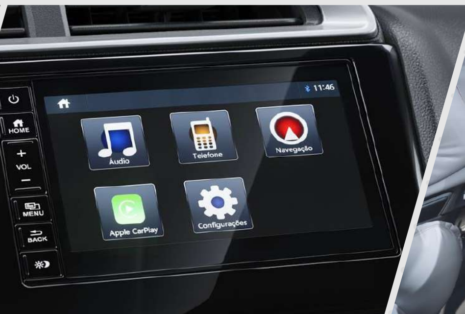
Pantalla táctil 7" con navegador