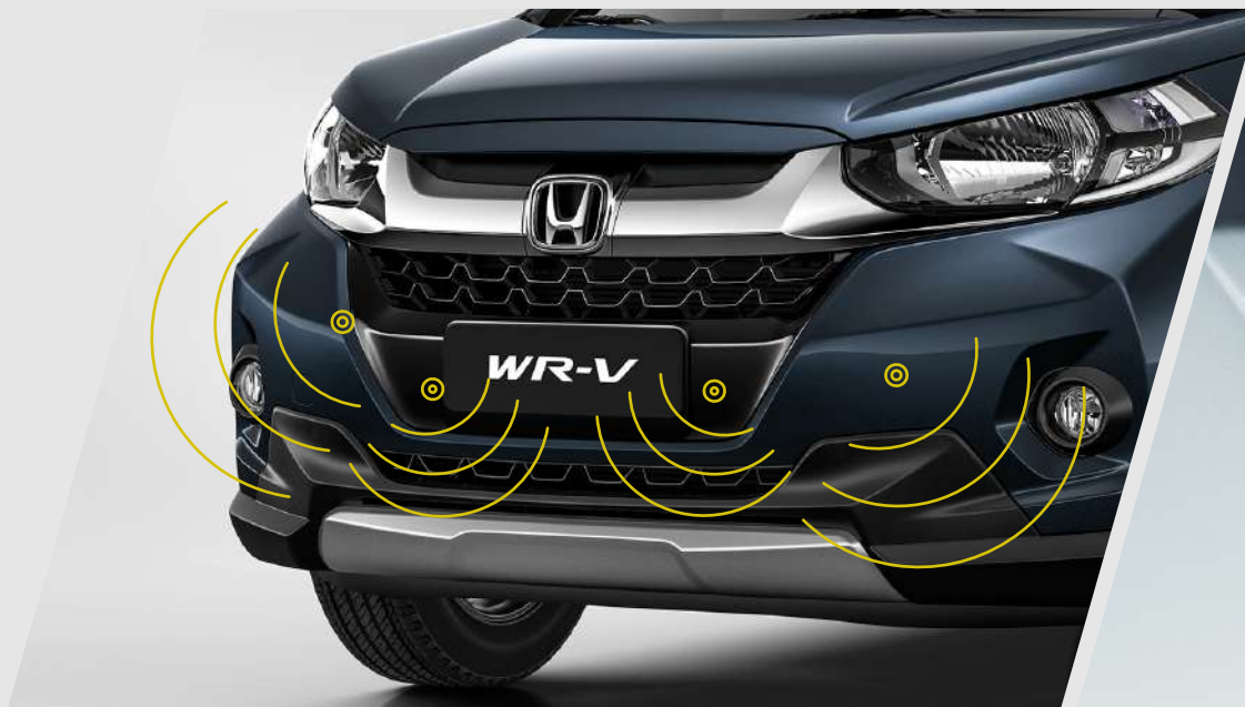
Sensores de maniobra delanteros