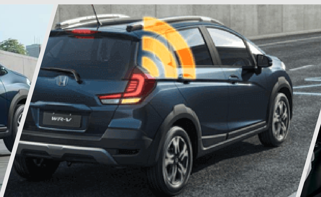
ESS – Sistema de alerta de frenado